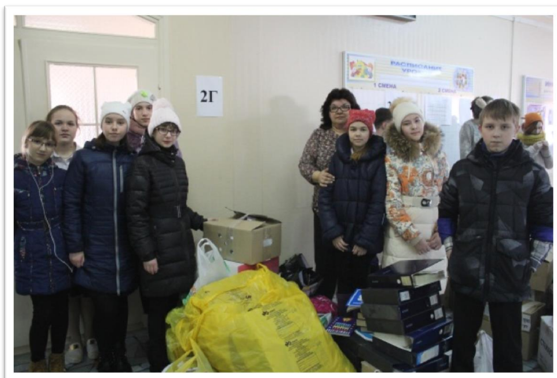
Рисунок 2. Городская акция «Сделаем мир чище»