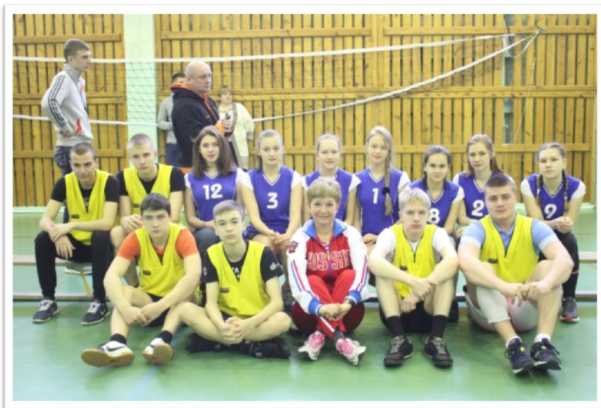
Рисунок 4. Муниципальный этап всероссийских соревнований школьников «Президентские состязания» (9-10 классы)