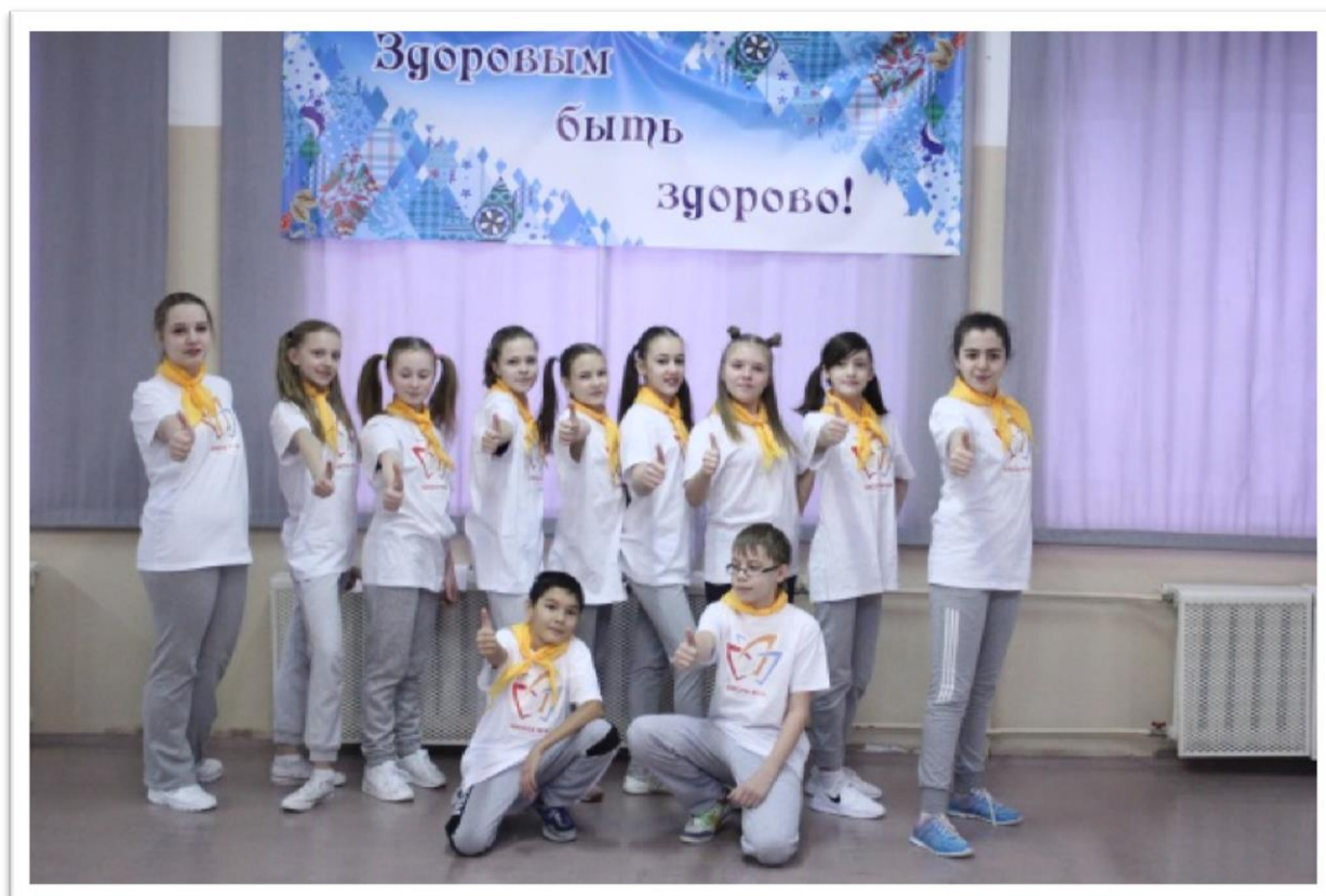
Рисунок 1. Городской конкурс «Здоровым быть здорово!»