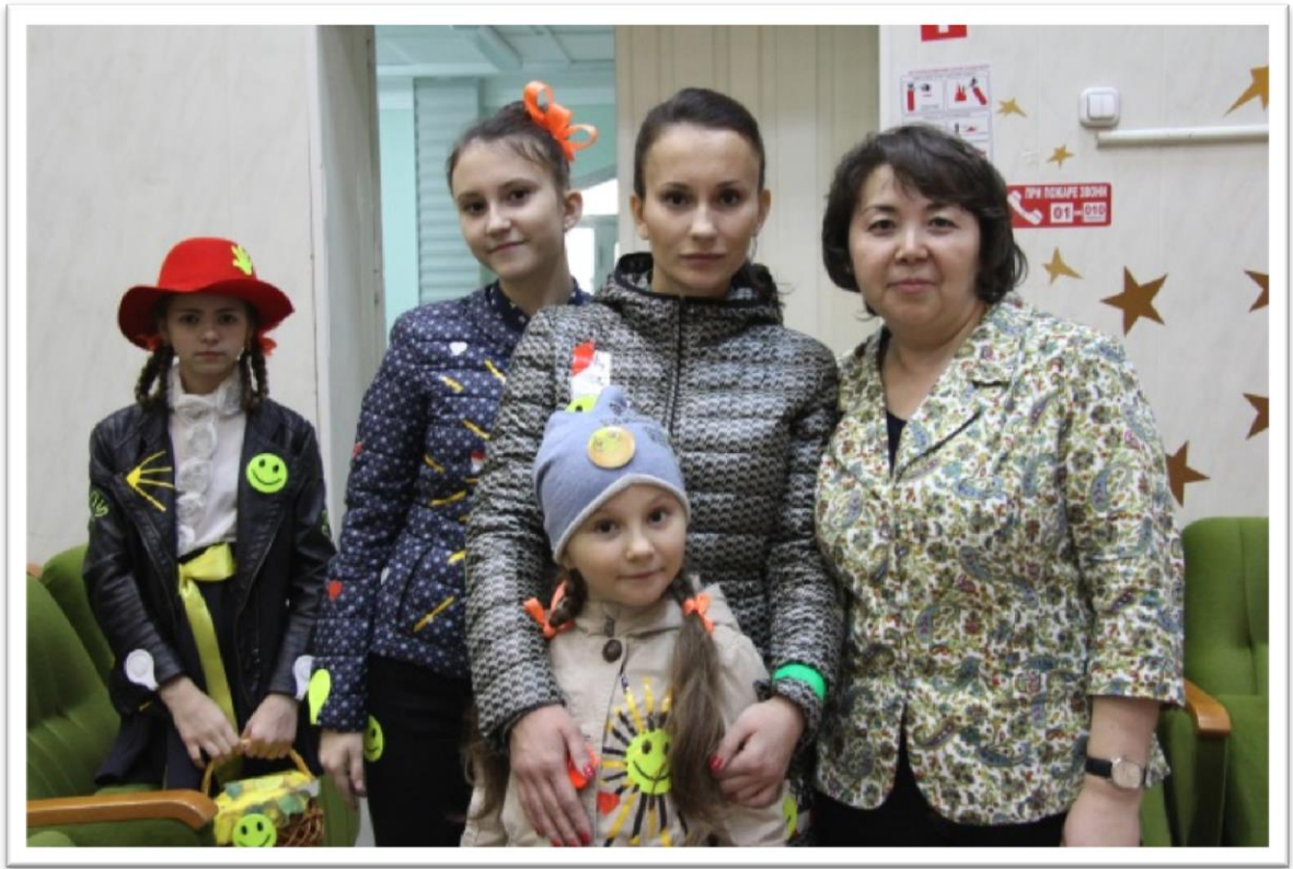
Рисунок 5. Городской конкурс « Стань заметней на дороге»