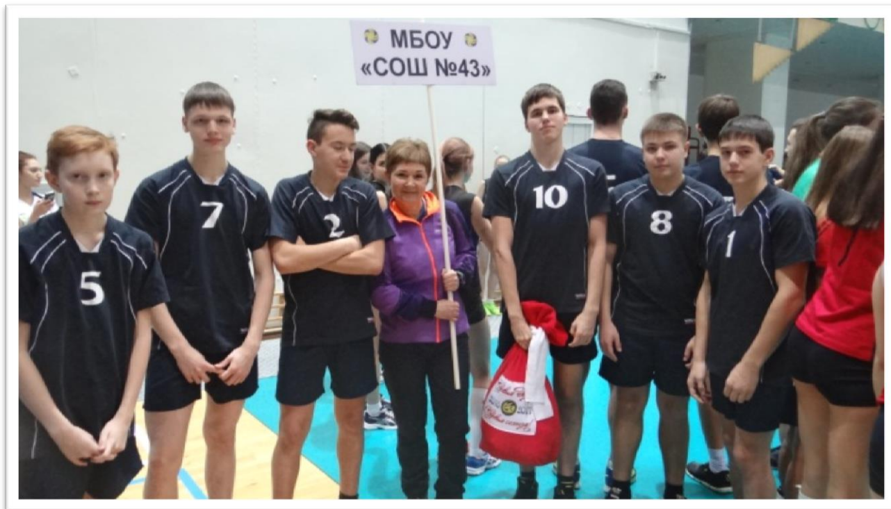
Рисунок 3. Городской турнир по баскетболу среди команд обучающихся юношей «КЭС – Баскет»